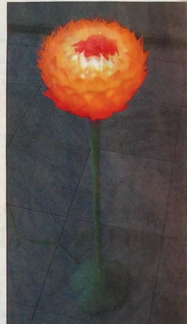
▲ Oraya Porphyrea.

hout niet. Met siliconen wel, omdat het flexibel is.” Niet alleen het materiaal maakt Reicherts bloemen realistisch. In een aantal van zijn lampen zijn ook echte bloembladeren verwerkt. De structuren zijn afgeke-